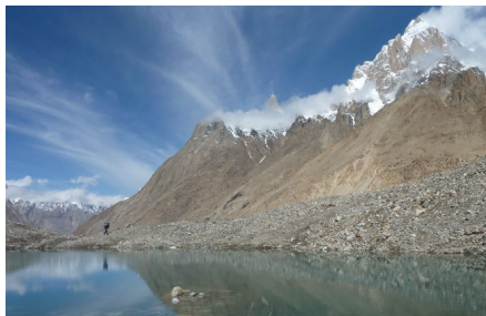
4. Anmarschtag am Weg nach Urdukas

Am 22. Juni erreichten wir bei sonnigem Wetter die Moräne am Fuße des K2, wo wir unser Basislager aufbauten. David und ich freuten uns sehr, da während des Anmarsches alles gut verlaufen war. Unsere Träger blieben gesund und waren zufrieden, das Wetter besserte sich von Tag zu Tag und bisher befand sich nur eine kleine Mannschaft mit zwei Bergsteigern im Basislager. Am späten Nachmittag kam noch ein amerikanisches Team dazu.