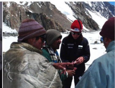
Die Träger werden ausbezahlt

Gestern (am 23. Juni) jedoch überschattete ein tragischer Unfall unsere Freude. Wir mussten zusehen, wie ein italienischer Bergsteiger, der gemeinsam mit einem schwedischen Profischifahrer links von der Cesen Route mit Skiern abfahren wollte, ca. 600 Meter abstürzte.